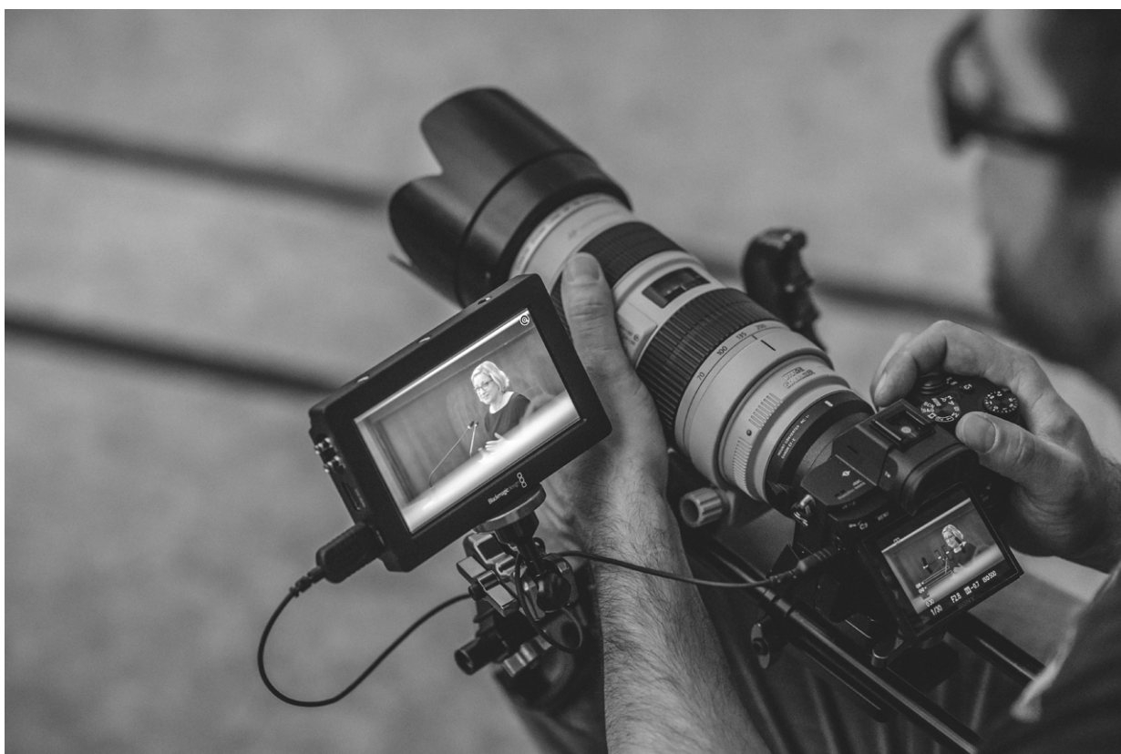
Audiovizuální záznam přednášky Fair Art