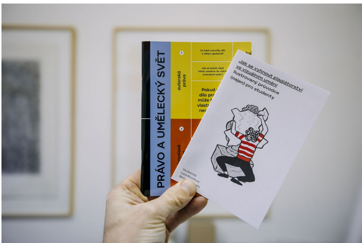
Publikace Právo a umělecký svět (verze z roku 2016) a Jak se vyhnout plagiátorství ve výtvarném umění (2021), obě vytvořeny odborníky Fair Art a pravidelně využívány v rámci výuky.